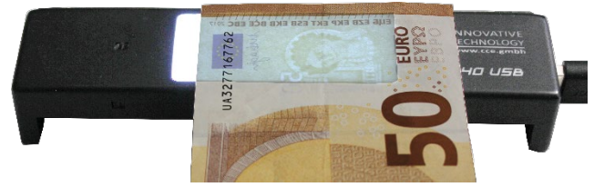
Weisslicht Detektion für Wasserzeichen