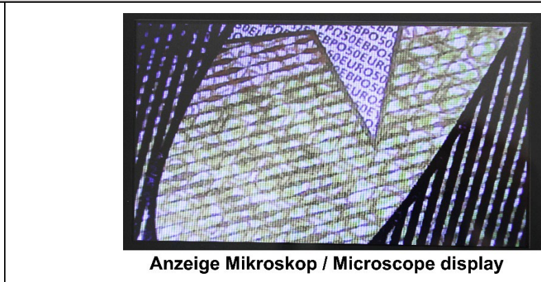
Anzeige Mikroskop / Microscope display