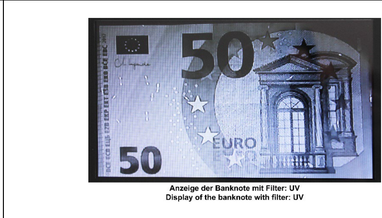
Anzeige der Banknote mit Filter: UV Display of the banknote with filter: UV