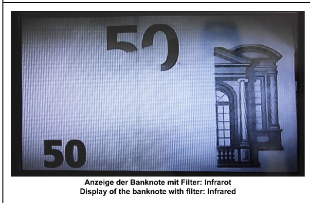
Anzeige der Banknote mit Filter: Infrarot Display of the banknote with filter: Infrared