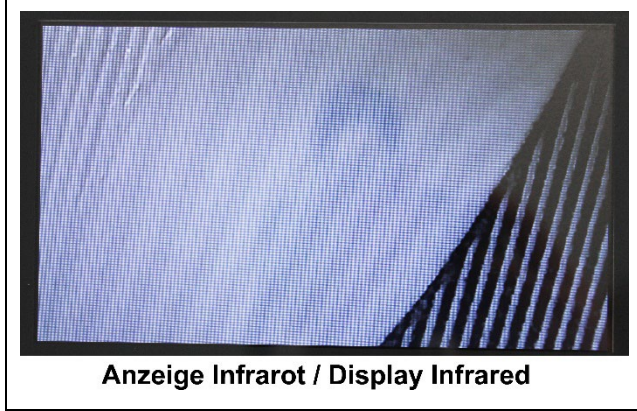
Anzeige Infrarot / Display Infrared