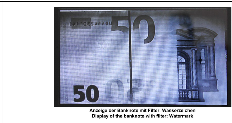
Anzeige der Banknote mit Filter: Wasserzeichen Display of the banknote with filter: Watermark