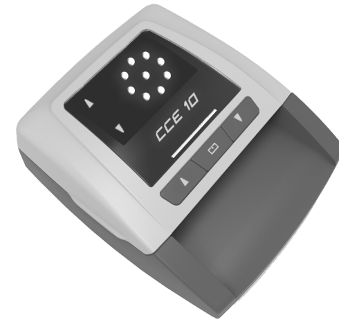
Elektronisches Falschgeldprüfgerät Electronic Counterfeit Money Detector

If you wish to return equipment for repair or service, please generally use the RMA counterfeit detector form on the website www.cce.gmbh in the Service section. There you will also find all the necessary information for returns processing.